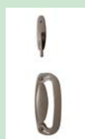
Metro Tribeca Stone色 (標準)