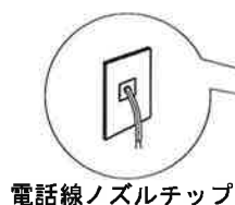
電話線ノズルチップ